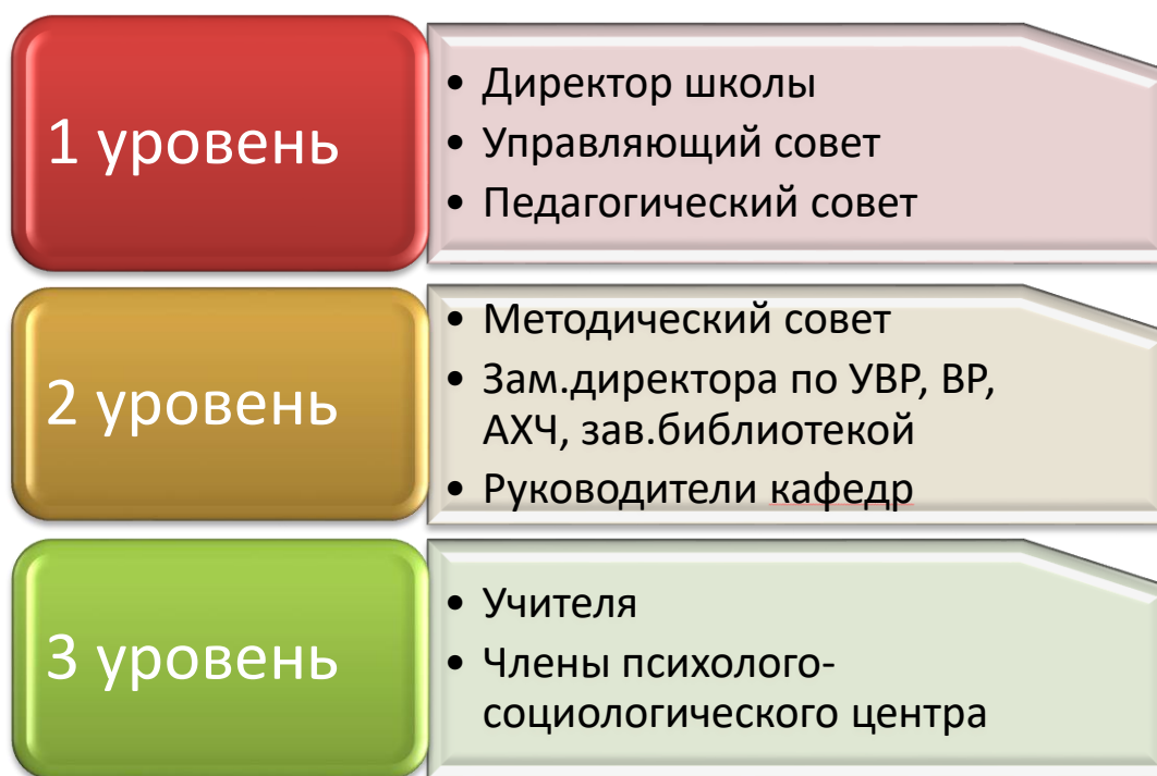
Рис.4 Система управления образовательным процессом в школе

В школе проводится системная работа со всеми участниками образовательного процесса.