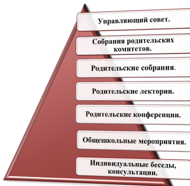
Рис. 5 Система взаимодействия с родителями

В школе проводится системная работа со всеми участниками образовательного процесса.